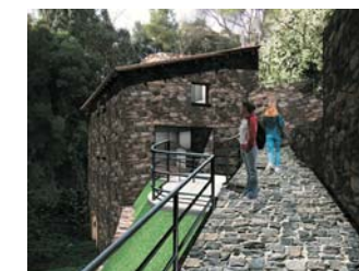
Pàg. 3 El Molí de l'Esclop serà rehabilitat dins la segona fase de millores al passeig de la Riera