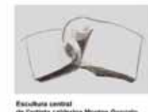
Escultura central de l'artista catalana Montse Gonzalo