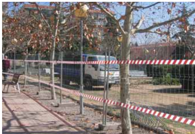
El Parc del Bugarai

El parc estarà tancat al voltant de tres mesos, temps que es dedicarà a la redistribució d'espais, la instal·lació de nou mobiliari urbà i del regatge gota a gota, la reforma de l'enllumenat públic, la reparació dels jocs existents i la incorporació de jocs nous, la millora de l'enjardinament i de les entrades i la col·locació de l'espai lúdic per a gent gran.