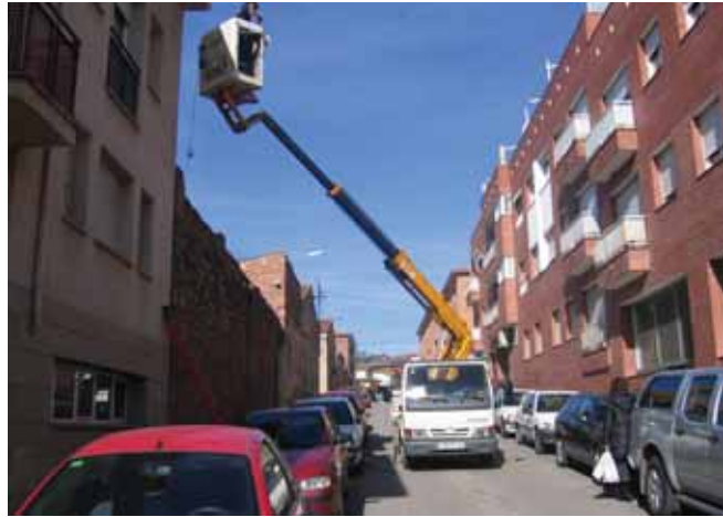
Operaris modificant l'enllumenat

Els carrers inclosos en aquesta fase del projecte són: c. del Bisbe Soler, c. de Sant Damià, c. de Ramon i Cajal, c. de Pau Cuscó, c. de Salvador Espriu, c. de l'Estació, c. de Llorenç Artigues, c. de Santa Eulàlia, c. de Gregori Montserrat, c. de Raval Canyelles, c. del Molí i c. del Sol.