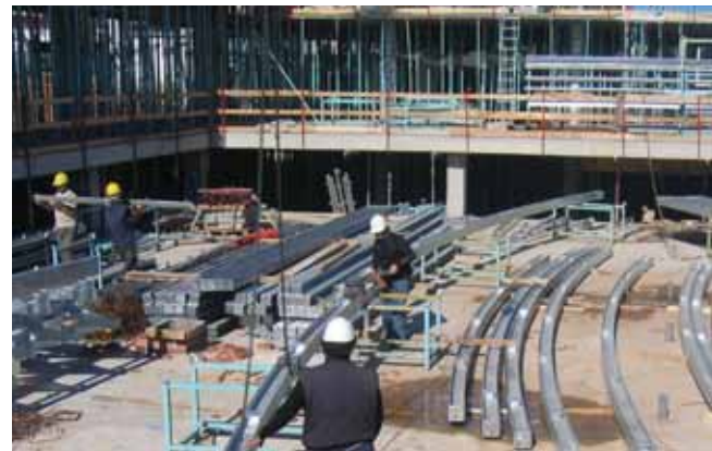
Obres a la nova piscina municipal

Tot i la complexitat de l'obra, la construcció de la zona esportiva les Cremades avança al ritme previst per tal d'obrir aquest estiu. Destaca d'aquestes últimes setmanes l'arribada de les peces per a la construcció de la coberta mòbil que tancarà les piscines a l'hivern i es retirarà a l'estiu. Aquest sistema de coberta mòbil és un dels elements del nou complex que permetrà l'estalvi energètic, perquè està pensat per aprofitar al màxim l'energia solar. Paral·lelament a la instal·lació de la coberta es construeixen els vasos de les dues piscines que tindrà el complex.