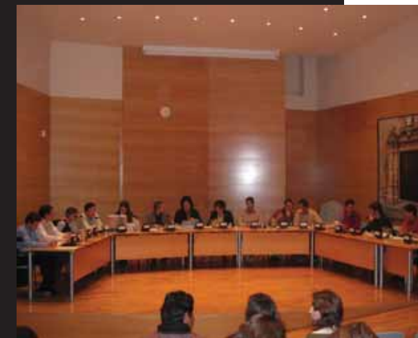
El pressupost es va aprovar al Ple del 22 de febrer