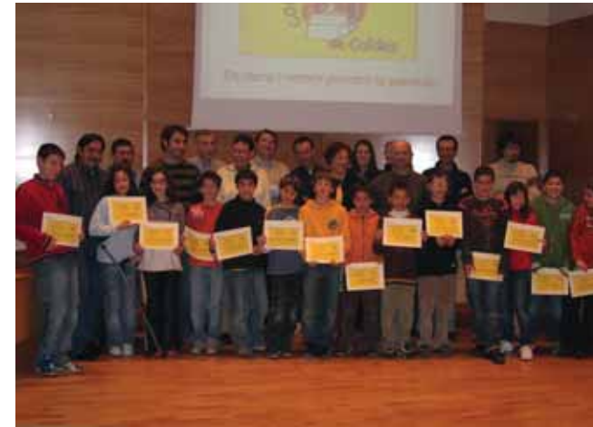
Nens i nenes a la sala de Plens

Les instal·lacions van obrir el maig de l'any 1998 i va tancar el primer any amb 1.308 entrades. La utilització de l'equipament ha anat creixent i ara ja fa dos anys que supera les 8.000 entrades anuals.