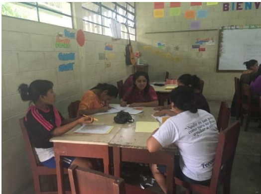
Treballs de comprensió lectora