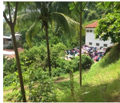
Edifici de l'internat on viuen les joves