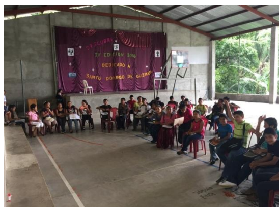
Classe amb els noies i les noies externs