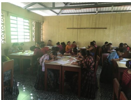
Classe amb les noies internes