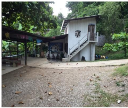
Vistes des de l'entrada del centre