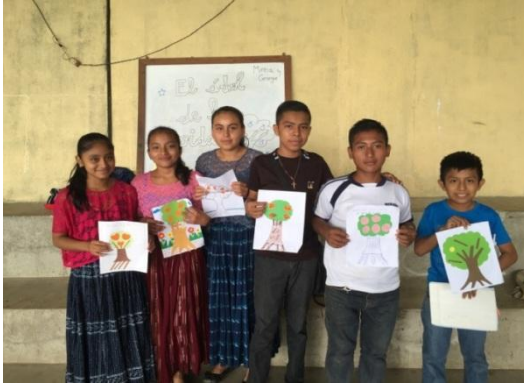
Activitat de "L'arbre de la vida"