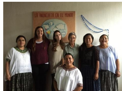
Germanes Dominicas de Cahabón

Des de la direcció del centre se'ns va demanar incidir en alguns temes, els quals vam treballar, i tanmateix, a través de la observació quotidiana dels alumnes i les alumnes que vam poder realitzar, van exposar un seguit de propostes d'activitats al personal docent que els van semblar interessants.